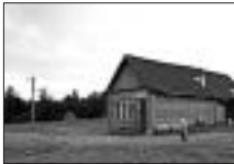
Auf dem Land