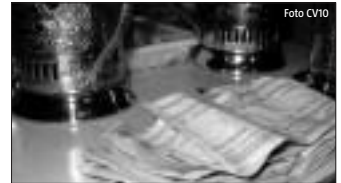
Nach dem Trinken kommt das Zahlen.

★ Wissen Sie, wie schön das war in Minsk, im überfüllten Trolleybus den Skoriny-Prospekt entlangzufahren? Während die schweren Metrozüge sich in der Dunkelheit des belarussischen Untergrunds den Weg bahnen, quetscht man sich gemütlich zwischen der Arbeiterklasse und bestaunt die Sehenswürdigkeiten der hell und feierlich beleuchteten Prachtstraße der Hauptstadt: die Siegesssäule, den Präsidentenpalast, die Präsidentenadministration, die Nationalbank, den Platz der Unabhängigkeit. Und alles erstrahlt im Glanz der Elektrizität, die auch den Trolleybus in Bewegung versetzt. Die Abschaltung der Straßenbeleuchtung in den Randbezirken und die Stilllegung einiger Fabriken haben es möglich gemacht. In diesen schweren Zeiten muss Lukaschenko kräftig sparen. Die wirtschaftliche Vernunft hat endlich gesiegt! Die Ressourcen müssen effektiv und sinnvoll verteilt und eingesetzt werden – entschied man in der Regierung. Heute fährt kein Trolleybus mehr den hell strahlenden Skoriny-Prospekt entlang. Der Präsidentenpalast hat eine neue Lichterkette und die Metrozüge einen Waggon mehr. (МАДЖИМ ГРУШЕВОЙ)