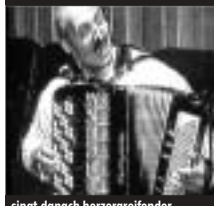
singt danach herzergreifender ...