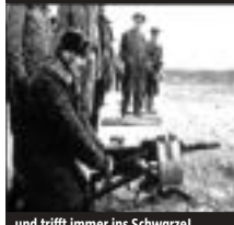
und trifft immer ins Schwarze!