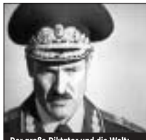
Der große Diktator und die Welt:

3:00 Albtraum: Beim Pokern mit Putin verlieren Sie Ihr Land und müssen zurück ins Traktorenwerk. Dann berühren Sie die Kalaschnikow unterm Kopfkissen und träumen weiter: von Weltherrschaft und Mamas Soljanka. (SEBASTIAN HEINZEL)