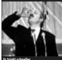
Er trinkt schneller ...