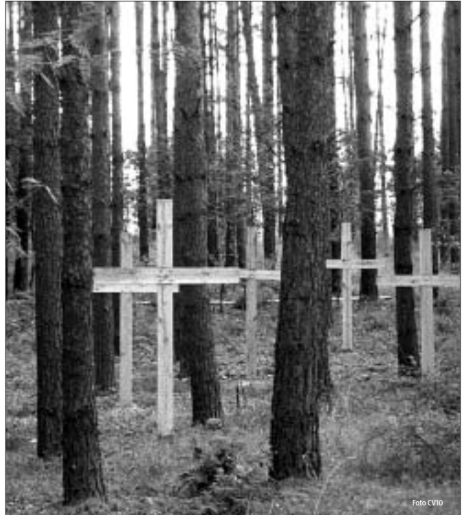
Gedenkstätte Kurapaty, ein Massengrab aus Stalins Zeit. Heute stehen hier Kreuze – gegen das Regime und das Vergessen.